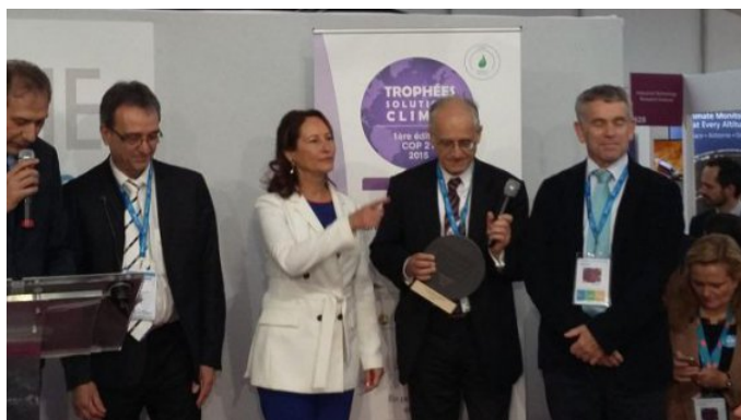
Ségolène Royal remet le Trophée à Pierre Langer